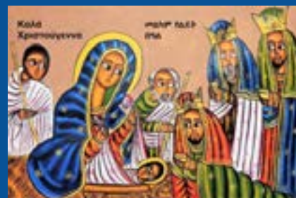
Ευτυχισμένο το 2026

Ευχόμαστε τις άγιες μέρες των Χριστουγέννων και της Πρωτοχρονιάς, να απολαύσετε στιγμές ηρεμίας και αναζωογόνησης με τις οικογένειές σας.