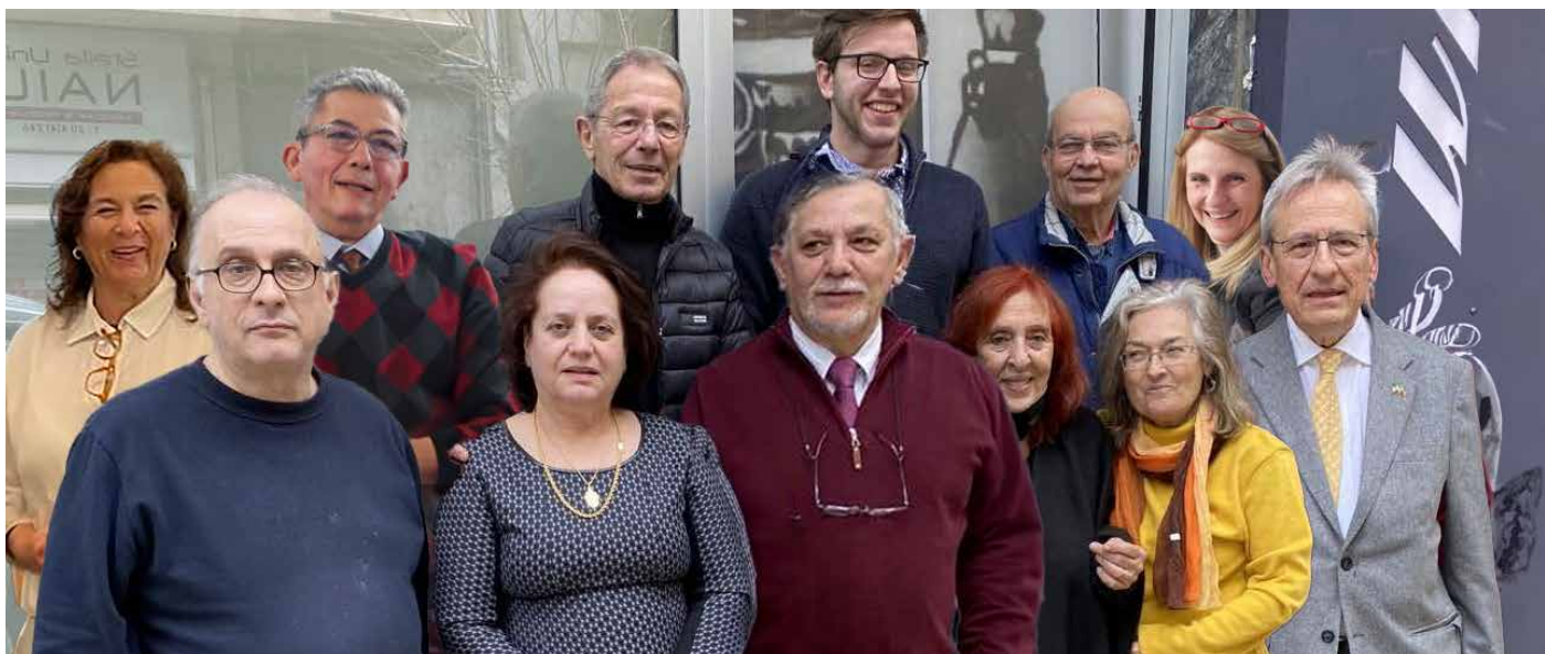
Τακτικά και αναπληρωματικά μέλη