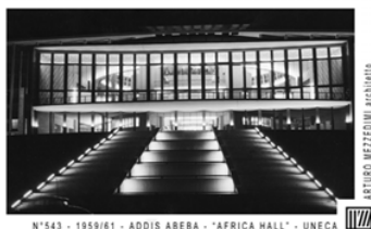
N°543 - 1958/61 - ADDIS ABEBA - "AFRICA HALL" - UNECA

Η ίδρυση της Οργάνωσης της Αφρικανικής Ενότητας, που έλαβε χώρα στην Αφρικανική Αίθουσα, συνοδεύτηκε από το μοντέρνο και δυναμικό παναφρικανιστικό αίσθημα της δεκαετίας του 1950 που δημιουργήθηκε και κατευθυνόταν από τον Πρόεδρο της Γκάνας Kwame Nkrumah.