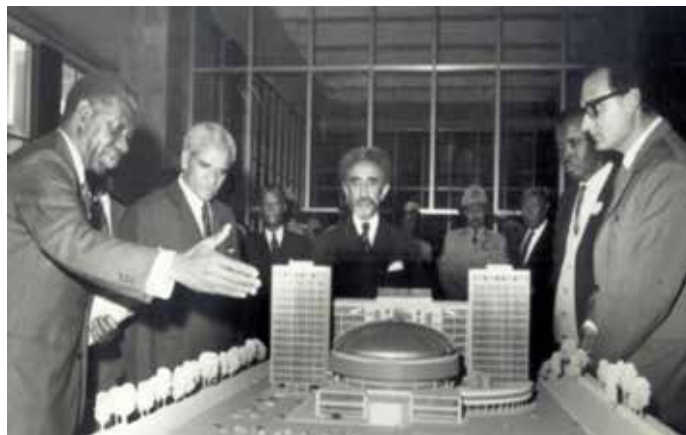
Οι εικονιζόμενοι από Αριστερά προς τα Δεξιά είναι: Εκπρόσωπος της εταιρείας, ο πρωθυπουργός κ. Aklilu Habte Wold, ο αυτοκράτορας, ο δήμαρχος της Αντίς Αμπέμπα Zewde Gebrehiwot και ο Arturo Mezzedimi

«Το κτίριο έχει έκταση 75.000 m 2 και περιλαμβάνει 260 γραφεία, αίθουσα συνελεύσεων με 800 θέσεις σε ταυτόχρονη μετάφραση, έξι αίθουσες για επιτροπές από 30 έως 60 θέσεις, βιβλιοθήκη, αίθουσες μόνιμων εκθέσεων, αίθουσες πάρτι, φουαγιέ με μπαρ για το κοινό, γκαλερί για περιήγηση στα αξιοθέατα και δωμάτια για τράπεζες, γραφεία αεροπορικών εταιρειών και τουριστικές εταιρείες», έγραψε ο Jacopo Galli.