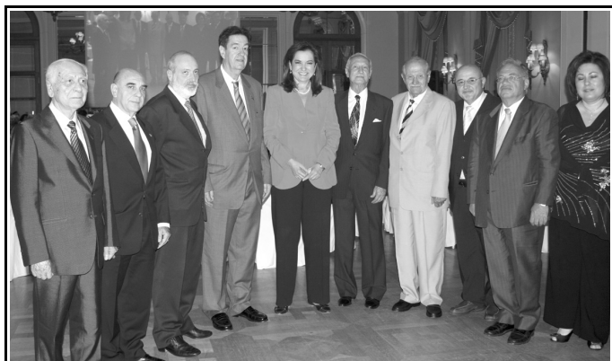
Η Υπουργός των Εξωτερικών με τον Πρόεδρο της Ο.Σ.Ε.Α. κ. Άρη Λυχνάρη και τους Προέδρους των Σωματείων Ελλήνων της Αφρικής

Με την ευκαιρία της επετείου των 30 χρόνων από την ίδρυση της Ομοσπονδίας Σωματείων Ελλήνων Αφρικής (Ο.Σ.Ε.Α.), την Τετάρτη 20 Μαΐου διοργανώθηκε, υπό την αιγίδα του Υπουργείου Εξωτερικών, επίσημο δείπνο στο ξενοδοχείο Μεγάλη Βρετανία, όπου προσεκλήθησαν Υπουργοί, ο Πατριάρχης Αλεξανδρείας Θεόδωρος Β', ο Μητροπολίτης Αζώμης Πέτρος, οι Διπλωματικοί αντιπρόσωποι των Αφρικανικών κρατών, τα μέλη των Διοικητικών Συμβουλίων και οι τέως Πρόεδροι των Συλλόγων Αφρικής.