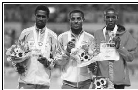
Ο Κενενίσα Μπεκέλε μαζί με τον Σιλέσι Σιχάνι στο βάθρο των νικητών των 10.000 μ.

Το 11ο Παγκόσμιο πρωτάθλημα Στίβου, υπό την αιγίδα της Παγκόσμιας Ομοσπονδίας Στίβου (IAAF), έλαβε μέρος στην Οσάκα της Ιαπωνίας από τις 25 Αυγούστου και έως τις 2 Σεπτεμβρίου 2007.