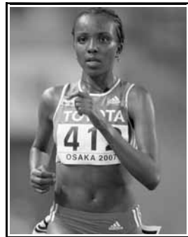
Η Τουρουνές Ντιμπάμπα καθώς πλησιάζει στο τέρμα των 10.000 μ.

Στα 5.000 μέτρα γυναικών, πρώτη ήρθε η Ολυμπιονίκης Μεσερέτ Ντεφάρ, κάτοχος των παγκοσμίων ρεκόρ στα 5000 μέτρα και 3000 μέτρα κλειστού στίβου.