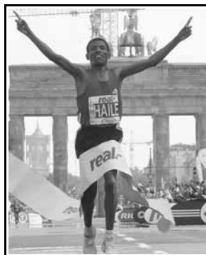
Ο Γκαμπριεσελάσι καταρρίπτει το Παγκόσμιο Ρεκόρ του Μαραθωνίου

Στις 30 Σεπτεμβρίου 2007 ο Χάιλε Γκαμπριεσελάσι κατέρριψε το παγκόσμιο ρεκόρ του Μαραθωνίου στο Βερολίνο με 2 ώρες 4 λεπτά και 26 δευτερόλεπτα. Το προηγούμενο ανήκε στον Κενυάτη Πολ Τεργκάτ και το οποίο είχε πραγματοποιηθεί στην ίδια διοργάνωση τον