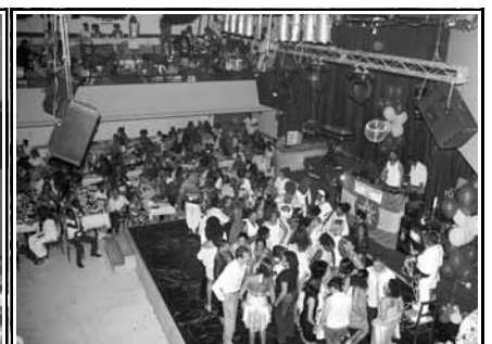
Στιγμιότυπα από την βραδιά