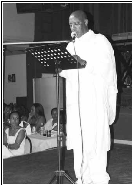
Ο Πρέσβης της Αιθιοπίας ανοίγει την βραδιά

Όπως η Ελλάδα, έτσι και η Αιθιοπία είχε τη δυστυχία να γνωρίσει τη δική της χούντα, η οποία ξερίζωσε όχι μόνον εσάς αλλά και πάρα πολλούς από εμάς από τον τόπο μας. Επειδή όμως τώρα έχουν αλλάξει τα πράγματα, καλούμε τους φίλους μας που ζούσαν στην Αιθιοπία να ξαναγυρίσουν και να βοηθήσουν στην ανάπτυξη της χώρας, ξεχνώντας αυτά που έκανε το προηγούμενο καθεστώς. Και να έλθετε όχι μόνον εσείς, αλλά να πείσετε και άλλους συμπατριώτες σας να έρθουν να επενδύσουν στη χώρα μας. Η κυβέρνηση προετοιμάζει το πρόσφορο έδαφος για το σκοπό αυτό. Ευχόμαστε η σχέση ανάμεσα στην Αιθιοπία και την Ελλάδα να παραμείνει δυνατή και να αναπτυχθεί ακόμη περισσότερο.»