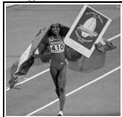
Μεσερέτ Ντεφάρ, νικήτρια των 5.000 μ. στο γύρω του θριάμβου.

Στα 10.000 μέτρα γυναικών η Τουρουνές Ντιμπάμπα μετά από μια συγκλονιστική κούρσα τερμάτισε 1η υπερασπίζοντας με επιτυχία τον τίτλο της παγκόσμιας πρωταθλήτριας που κατέχει.