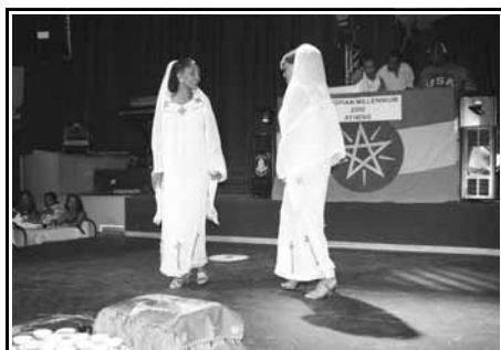
Στιγμιότυπα από την επίδειξη Αιθιοπικής μόδας