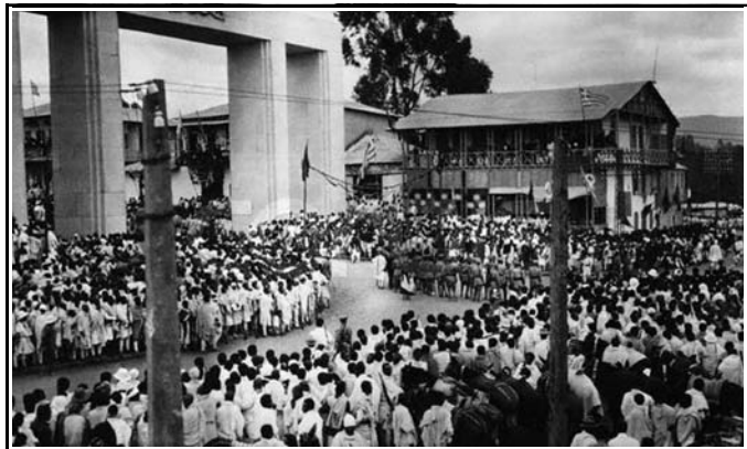
1935: Στρατιώτες και πολίτες στους δρόμους της Αντίς Αμπέμπα μετά την είδηση της Ιταλικής εισβολής