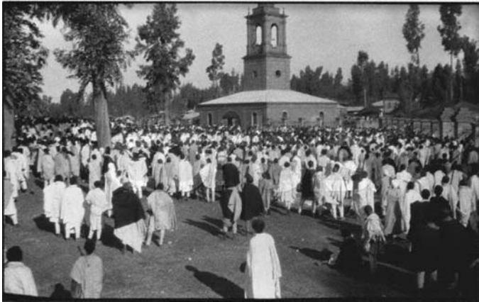
Μάρτιος του 1936: Πλήθος κόσμου σπεύδει στην εκκλησιά του Αγίου Γεωργίου να προσευχηθεί για την νικηφόρα έκβαση ενάντια στην Ιταλική εισβολή της 5ης Οκτωβρίου 1935

Οι Ιταλοί με τον καλά οπλισμένο στρατό, με αεροπορία και χρήση αερίων κερδίζουν τον πόλεμο.