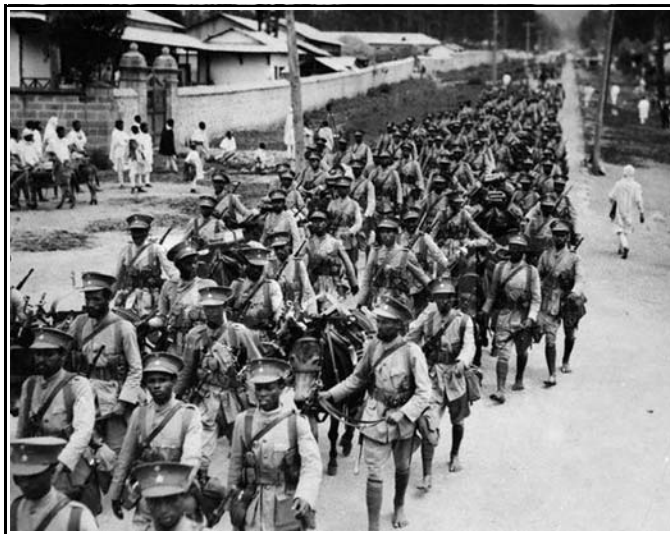
Πορεία στρατιωτών με μυδραλιοβόλα και πολεμοφόδια βαδίζουν προς την εκκλησία του Αγίου Γεωργίου, για τον εορτασμό του Σταυρού, 1935

Ο Μουσολίνι από τον καιρό που ανέλαβε την εξουσία και έγινε μεγάλος δικτάτορας, η επιθυμία του ήταν να κατακτήσει την Αιθιοπία με κάθε τρόπο. Γι' αυτό το λόγο άρχισε τον εξοπλισμό του στρατού του και όταν ήταν έτοιμος το 1934, βρίσκει την αφορμή και αρχίζει τις εχθροπραξίες στα σύνορα την Αιθιοπίας και Σομαλίας. Στο WELWEL του Ογκαντέν, ζητά να του παραχωρηθεί ένα μέρος από τα σύνορα. Η Αιθιοπία διαμαρτύρεται στην Κοινωνία των Εθνών που ήτο μέλος, δυστυχώς όμως χωρίς κανένα αποτέλεσμα. Συνέχεια η Ιταλία απαιτούσε από την Αιθιοπία να της ζητήσει συγγνώμη και να πληρώσει μεγάλη αποζημίωση σε τάλληρα Μαρίας Τερέζας, πράγμα το οποίο ήτο αδύνατον για την Αιθιοπία. Την παραμονή της 27ης Σεπτεμβρίου 1934, ημέρα του Σταυρού για τους Αιθίοπες, όπως πάντα συνηθίζεται την παραμονή, έγινε το «DAMARA» έξω από την εκκλησία του Αγίου Γεωργίου. Στήθηκαν τέντες για τους επίσημους και μπροστά από τις τέντες στήσανε τα ξύλα «TSIBO» για να τα ανάψουν μετά τη θεία λειτουργία. Οι μεγάλες Πρεσβείες όπως η Γαλλική, Γερμανική και Αγγλική, είχαν τους δικούς τους έφιππους σωματοφύλακες με