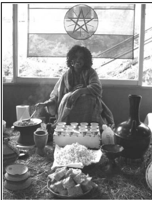
Στιγμιότυπο από την προετοιμασία καφέ

Στο μοναδικό χώρο της gallery, ο οποίος είχε διακοσμηθεί με χειροποίητα αντικείμενα αφρικανικής τέχνης, όλα φιλοτεχνημένα με παραδοσιακό