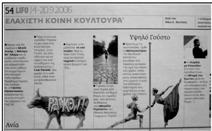
Αναφορές του Τύπου στο έργο «Καρδιά με κόκκαλα - Βίος και πολιτεία του Ναπολέοντα Λαπαθιώτη»

Γάιος Ιούλιος Καίσαρας Αύγουστος: Ρωμαίος Αυτοκράτορας. Γνωστός περισσότερο ως Καλιγούλας. Αναφέρεται και ως δεσπότης. Γεννιέται το 12μ.Χ. Μένει γνωστός για την εκκεντρικότητα και τη σκληρότητα του. Δολοφονείται το 41 μ.Χ., σε ηλικία 28 χρονών. Γεννιέται ξανά το 1936 μ.Χ. στη σκέψη του νεαρού διαλογιστή Αλμπέρ Καμύ. Το 1958 μ.Χ., 22 χρόνια αργότερα, τελειοποιείται η «υπέρτατη αυτοκτονία» του. «Και όμως είμαι ακόμα ζωντανός», προλαβαίνει να ψελλίσει πριν πέσει η αυλαία. Έτος 2007 μ.Χ. Τον αναζητούμε.