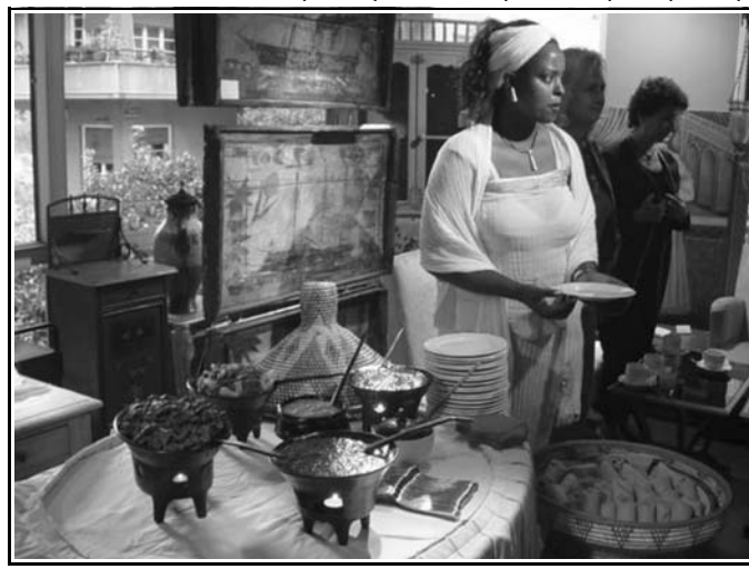
Πλούσιες αιθιοπικές γεύσεις μαγειρεμένες από το αιθιοπικό εστιατόριο Lalibela

Γυναίκες από την Αιθιοπία, ντυμένες με παραδοσιακές ενδυμασίες και χρησιμοποιώντας παραδοσιακά αιθιοπικά σκεύη προετοιμασίας και σεβρίσματος καφέ, ανέλαβαν να μυήσουν τους προσκεκλημένους των Coffeeway στην κουλτούρα του καφέ. Εξάλλου η προσφορά καφέ στην Αιθιοπία αποτελεί μια πράξη τιμητική που αποδεικνύει το σεβασμό και την εκτίμηση στο πρόσωπο του προσκεκλημένου. Για την απόλαυση του καφέ οι Αιθίοπες ακολουθούν την παραδοσιακή τελετή, η οποία έχει ενταχθεί στις συνήθειες της καθημερινότητάς τους, και μάλιστα σε αρκετές περιπτώσεις επαναλαμβάνεται πολλές φορές την ημέρα! Αυτό που κάνει την αιθιοπική τελετή μοναδική