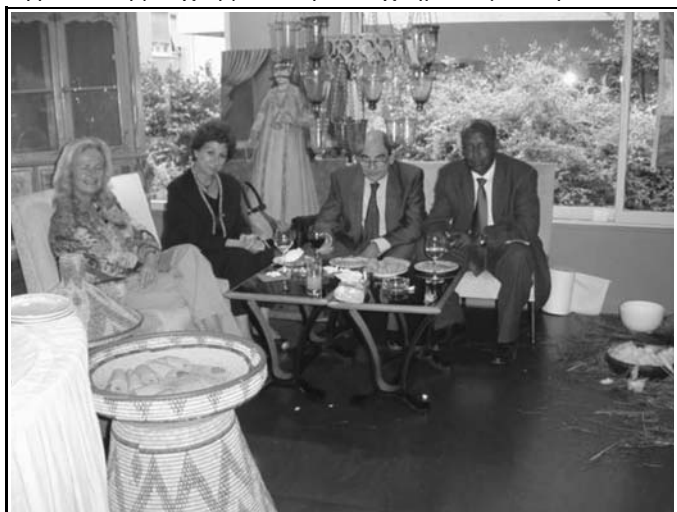
Ο πρέσβης της Αιθιοπίας και μέλη του Δ.Σ του Συλλόγου

Αυτό που κάνει την παραδοσιακή τελετή καφέ της