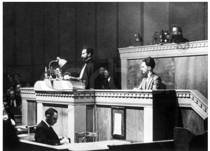
1936: Ο αυτοκράτορας Χαϊλέ Σελασιέ στην περίφημη έκκληση προς την Συμμαχία των Εθνών. Στην ομιλία του αυτή ζητά από την Συμμαχία βοήθεια για να σωθεί η χώρα από τους Ιταλούς εισβολείς.

του πετάξαν μια χειροβομβίδα και ο GRAZIANI τραυματίστηκε. Τότε οι φασίστες αγριεμένοι άρχισαν να σκοτώνουν και να καίνε τα σπίτια των Αιθιοπών. Αυτό κράτησε μερικές ημέρες. Οι σκοτωμένοι ανέρχονται στις τριάντα χιλιάδες. Από τότε τους απομονώσανε όλους και τους μεταφέρανε στην καινούργια πόλη MERKATO INDIGENO που μέχρι σήμερα φέρει το όνομα MERKATO.