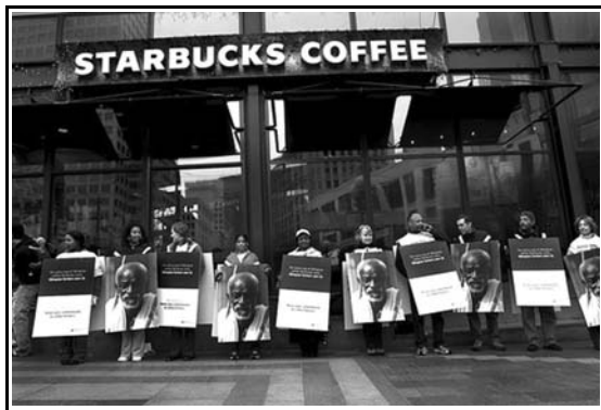
Ημέρα διαμαρτυρίας: χιλιάδες διαδηλωτές σε περισσότερο από 12 χώρες έλαβαν μέρος σε διαμαρτυρία που οργάνωσε η Oxfam κατά του Starbucks